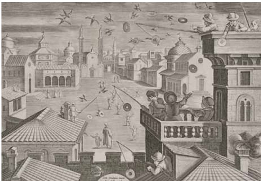
D'après Jan Van der Straet La chasse aux hirondelles pl. 85, burin, vers 1578 Coll. Musée de Gravelines

L'exposition Chasses sauvages présente trente gravures, appartenant à la collection du musée, issues d'une suite sur le thème de la chasse, Les Venationes , datée de 1578 (première édition). Il s'agit ici d'un ensemble représentatif, reconstitué à partir de gravures éparses, acquises successivement. La suite complète, dans sa seconde édition, comprenait 102 gravures au total. De 1553 à 1571, Jan Van der Straet, au service de Cosme I er de Médicis, œuvre pour la manufacture de tapisserie et s'attèle à la création de scènes de chasse qui doivent décorer en Toscane le palais de Poggio a Caiano. La suite gravée Les Venationes reprend les cartons de tapisserie, évoquant des chasses, pêches et combats d'animaux.