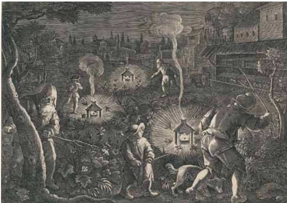
Jan Van der Straet (1523-1605) Chasse aux papillons burin, 1578-1580

Bien que s'appuyant sur une réalité, celle de la chasse, il ne s'agit pourtant pas ici de simples illustrations d'une encyclopédie cynégétique. En effet, si certaines scènes décrivent bien des chasses traditionnelles, la chasse à courre, ou la chasse royale au cerf, d'autres chasses apparaissent plus ou moins folkloriques, la chasse aux papillons ou le déguisement du chasseur en vache jupon, voire complètement excentriques. Ainsi les scènes de chasses exotiques décrivent des animaux aux formes et aux mœurs improbables, éléphants luttant contre des serpents, chasse aux panthères avec des miroirs... Enfin il représente avec beaucoup de verve les chasses mythologiques au dragon, à la licorne ou aux monstres marins. Les scènes les plus étranges peuvent cependant être décryptées et ont un sens symbolique.