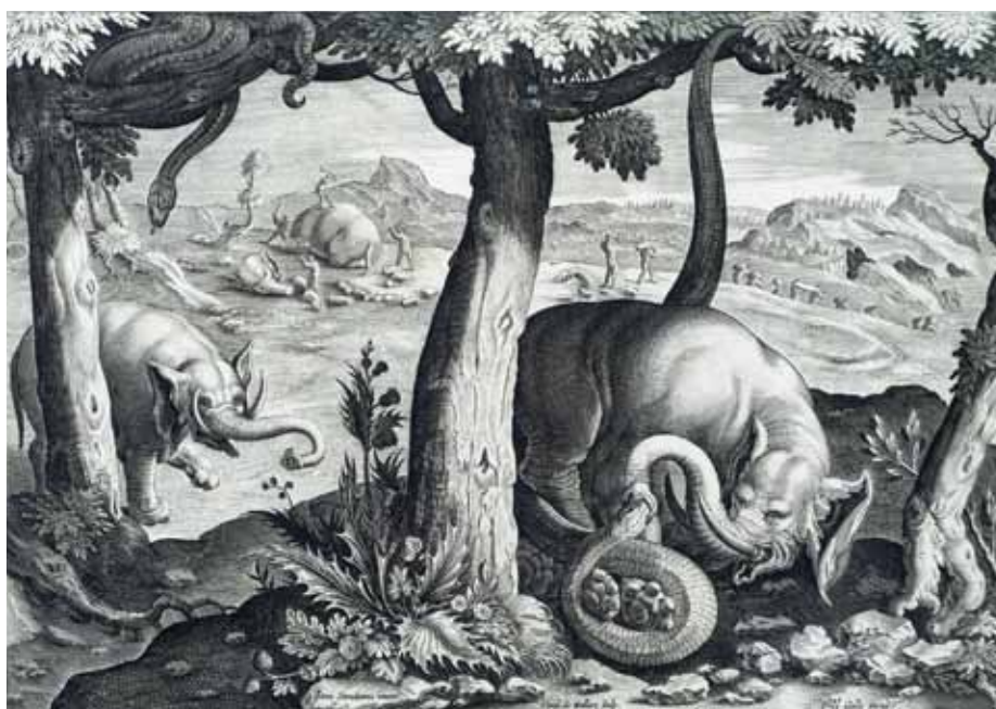
D'après Jan Van der Straet Combat de l'éléphant et du serpent (détail) pl. 2, burin vers 1578 Coll. Musée de Gravelines

Ci-dessus un éléphant à la physionomie improbable, sans doute inconnu de Van der Straet, livre un combat singulier contre un serpent gigantesque, tandis qu'à la lisière du bois, un autre pachyderme échappe à la poursuite des chasseurs. Cette scène surprenante évoque le duel entre le Bien et le Mal. L'éléphant, depuis le Moyen-Age chrétien, est un symbole de chasteté et de maîtrise de soi, opposé au perfide serpent.