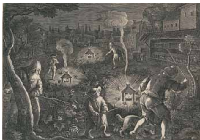
Jan Van der Straet (1523-1605) Chasse aux papillons burin, 1578-1580 Coll. Musée de Gravelines