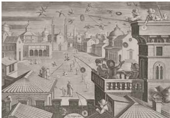
D'après Jan Van der Straet La chasse aux hirondelles pl. 85, burin, vers 1578 Coll. Musée de Gravelines