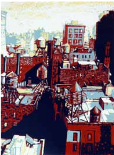
Pascale Hémary View from a window in Manhattan 2016, linogravure en couleurs