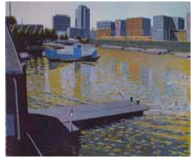
Wendelien Schönfeld Dijksgracht , 2011 gravure sur bois en couleurs 33 x 39 cm (coup de planche) 37 x 50 cm (feuille)