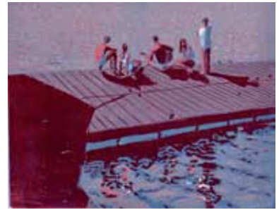
Wendelien Schönfeld Sérénade , 2011 gravure sur bois en couleurs 19 x 24 cm (coup de planche) 26 x 37 cm (feuille)