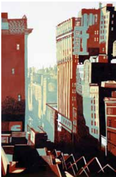
Pascale Hémary Vue du Flatiron Building, New York, 2014, gravure sur bois en couleurs 120 x 80 cm (coup de planche) 140 x 100 cm (feuille)