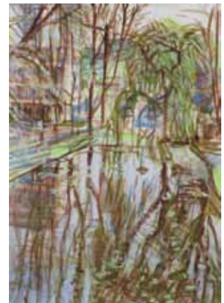
Wendelien Schönfeld Étang , 2012 gouache 32 x 24 cm (feuille)