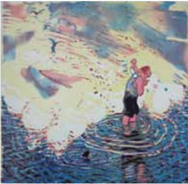
Wendelien Schönfeld Saint-Christophe , 2000 gravure sur bois en couleurs 50 x 50 cm (coup de planche) 51 x 51 cm (feuille)