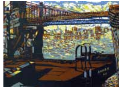
Pascale Hémary Embarquement to Brooklyn 2017, linogravure en couleurs 40 x 55 cm (coup de planche) 65 x 50 cm (feuille) Coll. Musée de Gravelines