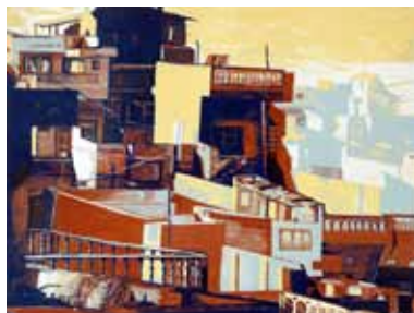
Pascale Hémary Udaipur I 2014, gravure sur bois en couleurs 60 x 80 cm (coup de planche) 70 x 90 cm