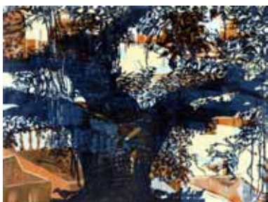
Pascale Hémary Le Banian d'Udaipur 2014, gravure sur bois en couleurs 60 x 80 cm (coup de planche) 70 x 90 cm (feuille)