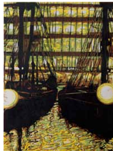
Pascale Hémery, St-Katharine docks in the City, London 2014, gravure sur bois en couleurs Coll. Musée de Gravelines