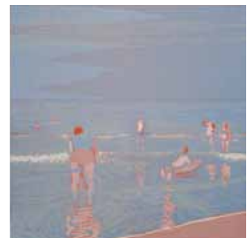
Wendelien Schönfeld Plage II , 2017 gravure sur bois en couleurs 23 x 23 cm (coup de planche) 27 x 34 cm (feuille)