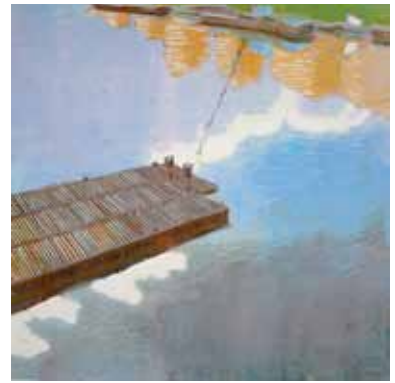
Wendelien Schönfeld Escalier vers le paradis 2016 gravure sur bois en couleurs 30 x 30 cm (coup de planche) 37 x 38 cm (feuille)