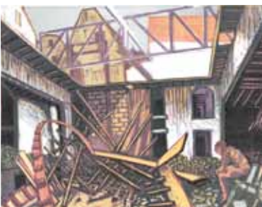
Wendelien Schönfeld Job , 1998 gravure sur bois en couleurs 25 x 33 cm (coup de planche) 37 x 44 cm (feuille)