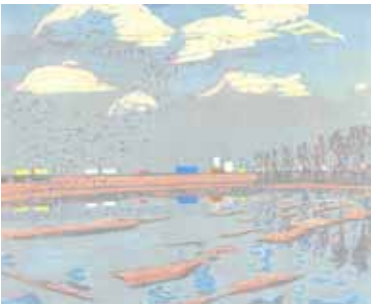
Wendelien Schönfeld Holendrecht , 2005 gravure sur bois en couleurs 30 x 35 cm (coup de planche) 38 x 50 cm (feuille)