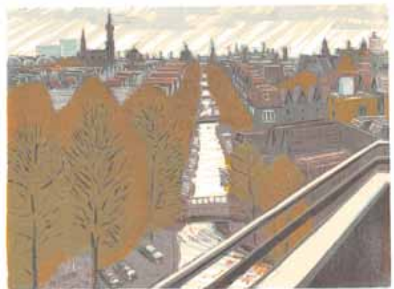
Wendelien Schönfeld Nassauplein vers le Nord 2004, gravure sur bois en couleurs