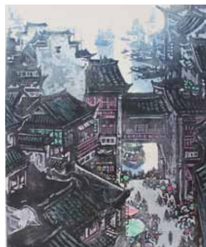
Zhixin Cai Embarcadère près du fleuve Qingyi gravure sur bois en couleurs, 1985 Coll. Musée de Gravelines