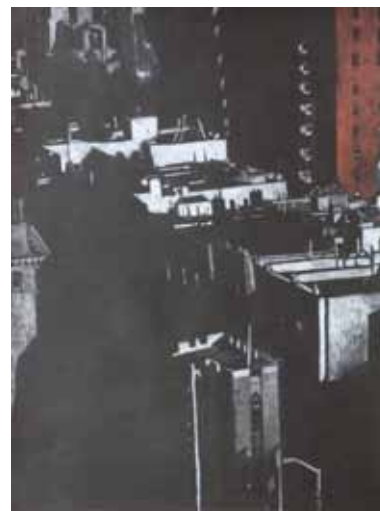
Pascale Hémary From the Heights, New York, Série noire # 2-2, New York 2016, dessin aux crayons de couleurs sur papier noir 65 x 50 cm (feuille)