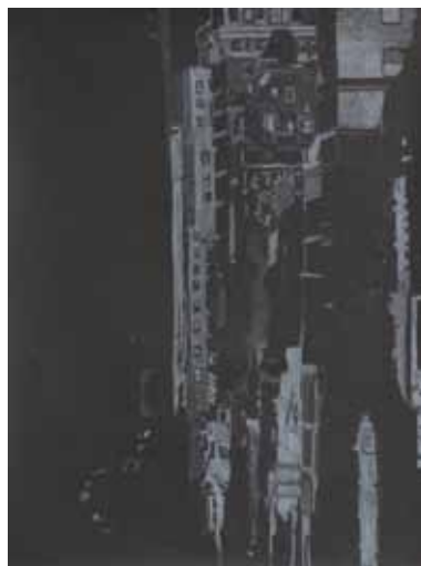
Pascale Hémary Union Square, New York, Série noire # 1, 2016 dessin à la craie blanche sur papier noir 65 x 50 cm (feuille)