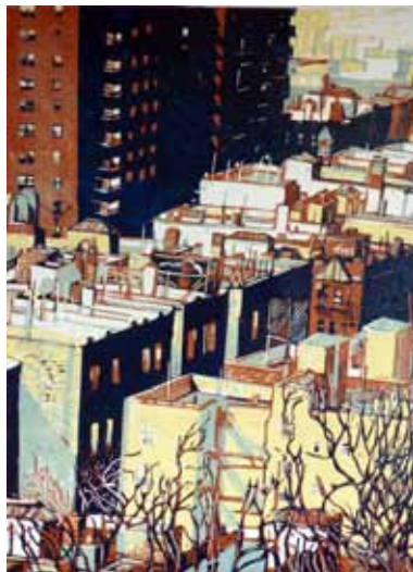
Pascale Hémary From the Heights I, New York 2016, linogravure en couleurs 50 x 36 cm (coup de planche) 65 x 50 cm (feuille)