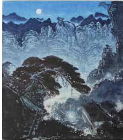
Zhiguang Liu La nuit au clair de lune, à Yandang gravure sur bois en couleurs, XX e 50 x 65 cm - Coll. Musée de Gravelines