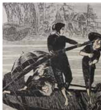
Chun Jiang La pluie à Hui gravure sur bois en couleurs 1982, 60 x 80 cm Coll. Musée de Gravelines