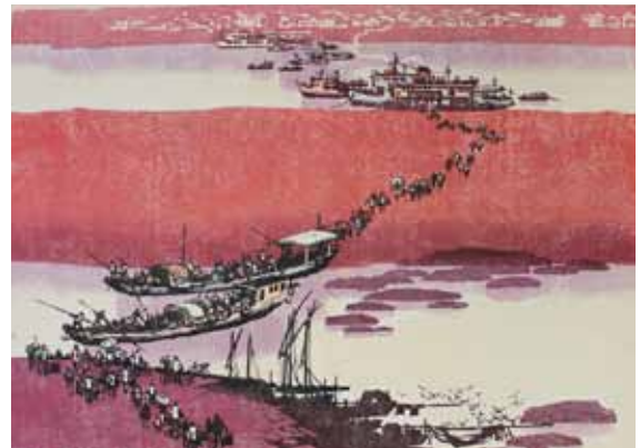
Pimo Huang La traversée du fleuve en automne gravure sur bois en couleurs, 1985 50 x 65 cm - Coll. Musée de Gravelines