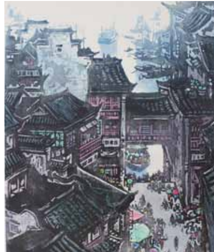
Zhixin Cai Embarcadère près du fleuve Qingyi gravure sur bois en couleurs, 1985 Coll. Musée de Gravelines