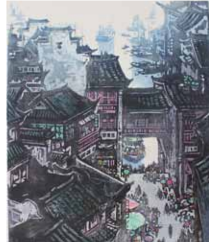
Zhixin Cai Embarcadère près du fleuve Qingyi gravure sur bois en couleurs, 1985 50 x 65 cm - Coll. Musée de Gravelines