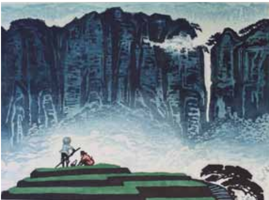
Fulin Yin, Après la pluie, le vent gravure sur bois en couleurs, 1988 50 x 65 cm - Coll. Musée de Gravelines