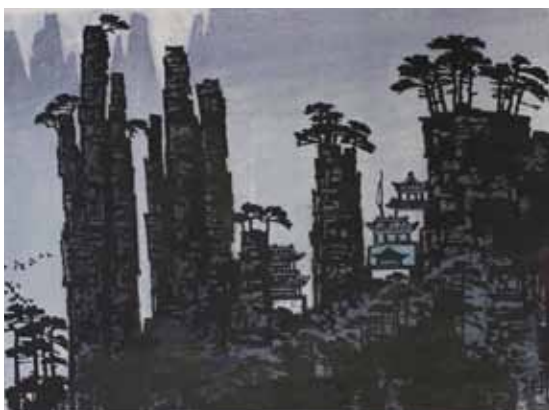
Dunxi Lin Les forêts de pierre gravure sur bois en couleurs, XX e 50 x 65 cm - Coll. Musée de Gravelines