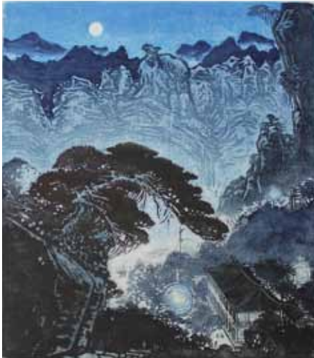
Zhiguang Liu La nuit au clair de lune, à Yandang gravure sur bois en couleurs, XX e Coll. Musée de Gravelines

Autour des années 80, la gravure sur bois était toujours pratiquée dans les ateliers. Elle est produite par des graveurs qui souvent exercent le métier d'enseignant en école d'art. Loin des avant-gardes et dans le contexte d'un marché de l'art presque inexistant, ces gravures apparaissent, pour un temps, à une charnière entre peinture classique et art populaire.