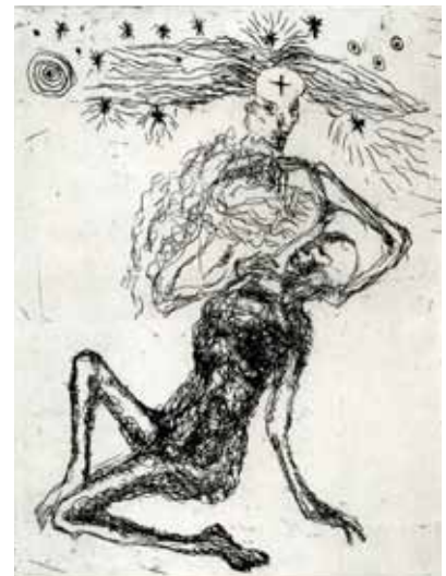
Marie-Christine Remmery (1962-) La voie , 2018, eau-forte Collection musée de Gravelines