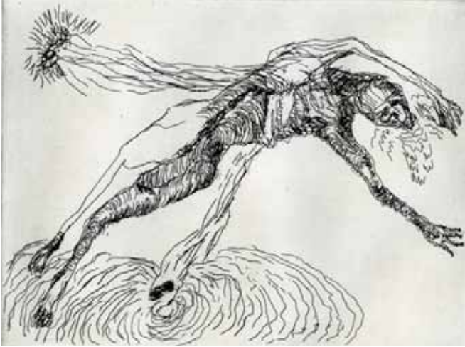
Marie-Christine Remmery (1962-) Au bord des limbes , 2018, eau-forte Collection musée de Gravelines