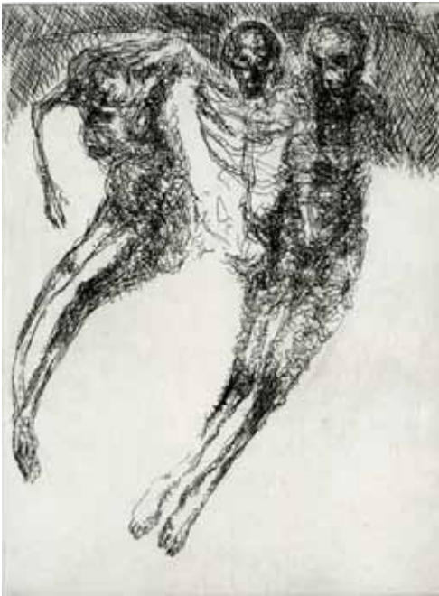
Marie-Christine Remmery (1962-) Le passage , 2018, eau-forte Collection musée de Gravelines