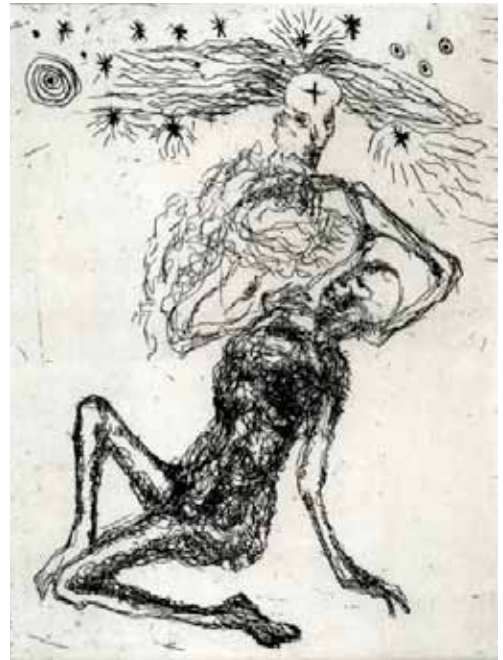
Marie-Christine Remmery (1962-) La voie , 2018, eau-forte Collection musée de Gravelines

De manière plus générale l'artiste figure la possibilité d'une connexion avec un monde invisible, avec d'autres plans de la réalité.