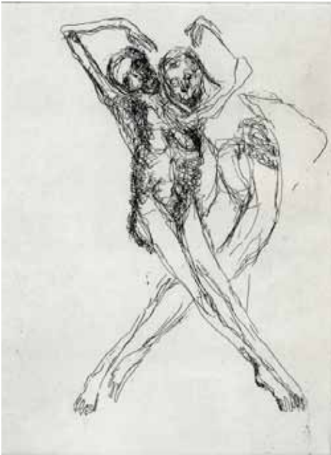
Marie-Christine Remmery (1962-) La grâce , 2018, eau-forte Collection musée de Gravelines