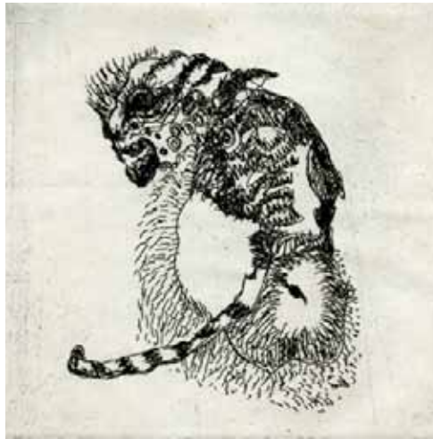
Marie-Christine Remmery (1962-) Tigre de papier 2018 eau-forte Collection musée de Gravelines