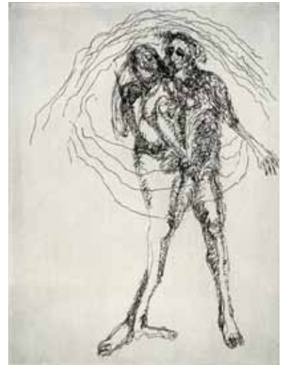
Marie-Christine Remmery (1962-) L'Amour , 2018, eau-forte Collection musée de Gravelines