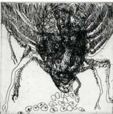
Marie-Christine Remmery (1962- ) Arachnée 2018 eau-forte Collection musée de Gravelines