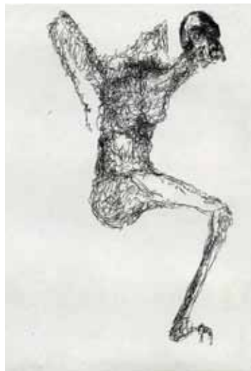
Marie-Christine Remmery (1962-) La pensée d'Icare , 2018, eau-forte Collection musée de Gravelines