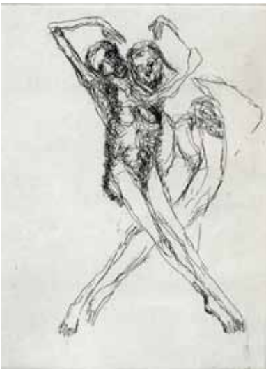
Marie-Christine Remmery (1962-) La grâce , 2018, eau-forte Collection musée de Gravelines