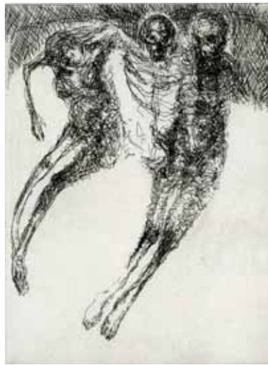
Marie-Christine Remmery (1962-) Le passage , 2018, eau-forte Collection musée de Gravelines