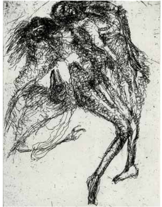
Marie-Christine Remmery (1962-) Vers l'inconnu , 2018, eau-forte Collection musée de Gravelines

Elle attribue aux créatures chimériques qu'elle engendre, les vertus d'un talisman. Ils portent une protection, ceux sont les anges gardiens, les bienveillants invisibles. Les corps s'assemblent eux-mêmes, Corps et âmes , Le Dilemme , les corps se doublent, des têtes échappent au dos des personnages, des crânes s'emboîtent en cascade, en abîme. Ses hommes sont multiples. Ils appartiennent à une réalité pressentie. Ils peuvent évoquer la double nature humaine : un corps, un esprit. Mais ces êtres doubles incarnent aussi notre propre ambiguë du point de vue moral. Ni noirs ni blancs.