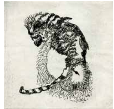
Marie-Christine Remmery (1962- ) Tigre de papier 2018 eau-forte Collection musée de Gravelines