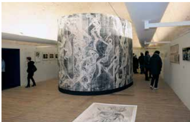
Exposition Charley Case, les innommés