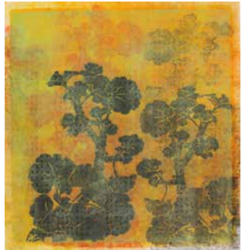
Hyun Jeung, Géranium IV , gravure sur bois en couleurs, 2020 - Collection particulière

Chaque gravure se décline en variations et en épreuves uniques. Ainsi, pour la série Pluie sur les lotus , imprimée en résidence sur les presses du musée, l'artiste réinterprète sans cesse son motif à partir de deux matrices et de nombreux passages d'impression. Chaque tirage varie, par des changements de couleur, par des superpositions de texture d'encre, de couleurs, de formes, des décalages ou des retournements en miroir, donnant à ses estampes uniques un caractère pictural.