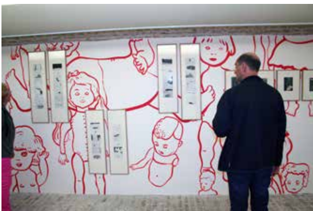
Exposition Françoise Pétrovitch, après les jeux