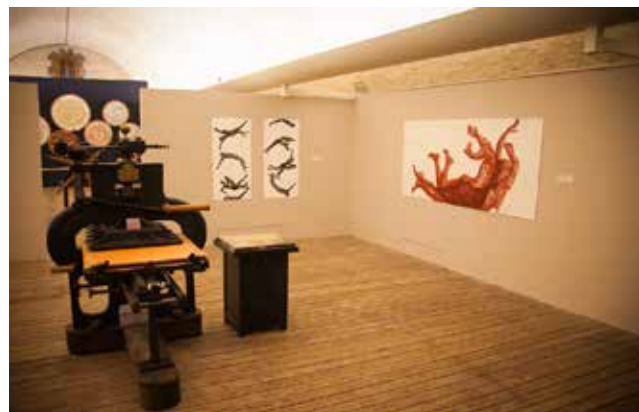
Exposition Agnès Dubart, mécanique céleste, sillonner le monde