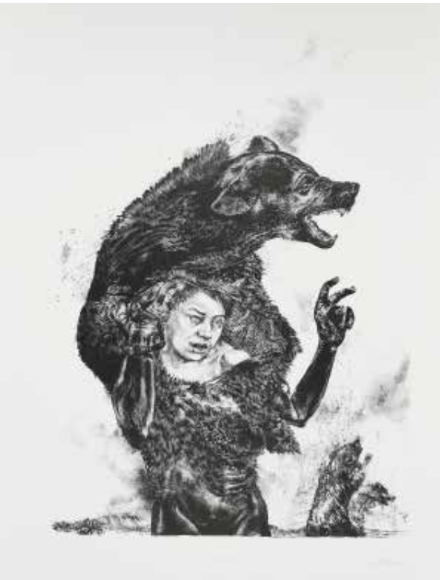
Diane Victor (1964 - ) The boy who cried wolf , lithographie, 2019 Coll. Musée de Gravelines