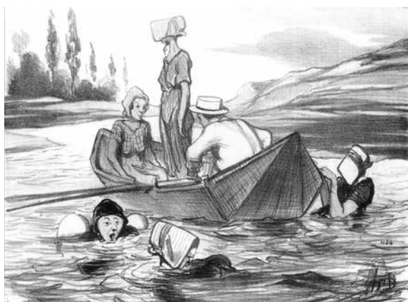
Honoré Daumier (1808 - 1879), En pleine eau de la série Les baigneuses , pl. 12, pour Le Charivari , du 29 août 1847 Coll. Musée de Gravelines