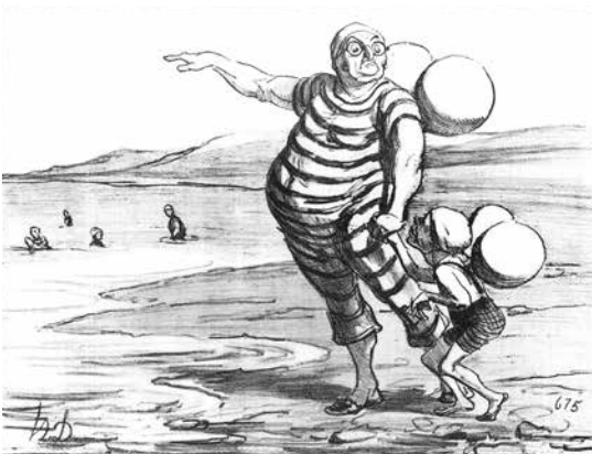
Honoré Daumier (1808 - 1879), Mon fils, la vessie a été donnée à l'homme, pour affronter les flots !... de la série Croquis aquatiques, pl. 8, pour Le Charivari, du 9 septembre 1854