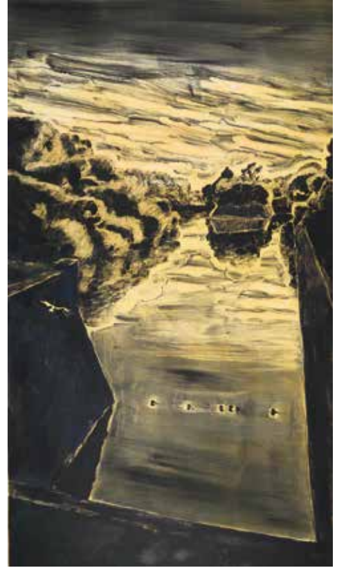
Assunta Genovesio (1972), Le bastion du Roi , 2019 monotype en couleurs - Coll. Musée de Gravelines