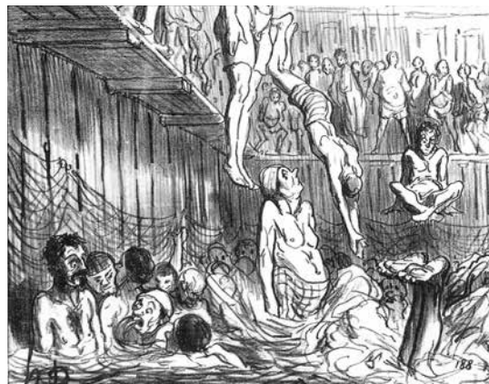
Honoré Daumier (1808 - 1879), Les bains à quatre sous de la série Croquis d'été, pl. 29, pour Le Charivari, du 28 juin 1858