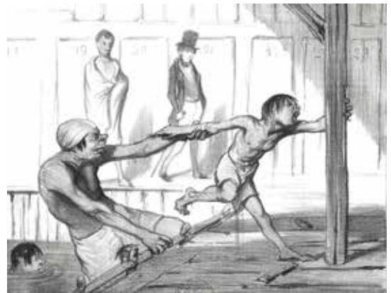
Honoré Daumier (1808 - 1879), Arrive donc marsoin ; a-t-on vu ce caniche là, ça veut être marin, ça se fait des bateaux avec des coquilles de noix et ça craint les bains à quatre sous de la série Les baigneurs , pl. 10, pour Le Charivari , du 27 septembre 1839 Coll. Musée de Gravelines