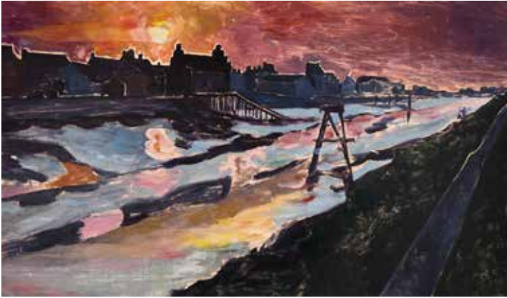
Assunta Genovesio (1972), Chenal à marée basse , 2022, monotype en couleurs Coll. Musée de Gravelines