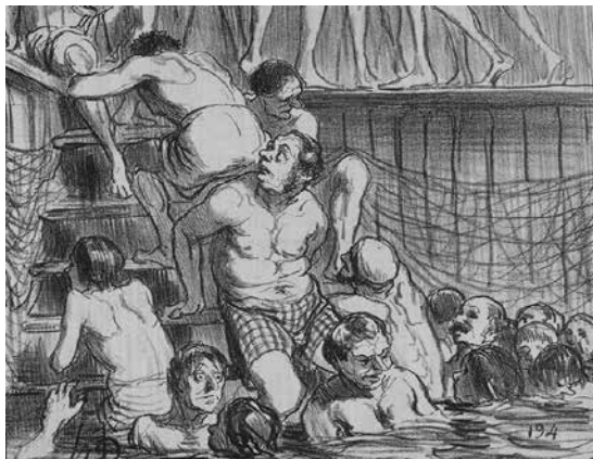
Honoré Daumier (1808 - 1879), Aux bains Deligny - L'échelle à quatre heures de la série Croquis d'été, pl. 33, pour Le Charivari, du 9 juillet 1858