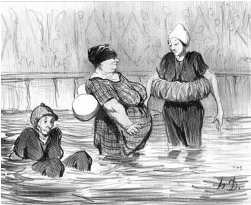
Honoré Daumier (1808 - 1879), Les baigneuses prudentes de la série Les baigneuses , pl. 8, pour Le Charivari , du 15 août 1847 - Coll. Musée de Gravelines