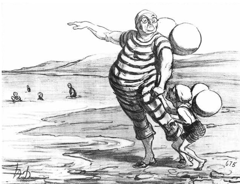
Honoré Daumier (1808 - 1879), Mon fils, la vessie a été donnée à l'homme, pour affronter les flots !... de la série Croquis aquatiques, pl. 8, pour Le Charivari, du 9 septembre 1854

(...) Familier des établissements de bains publics, principalement implantés dans les beaux quartiers de la capitale, Daumier s'intéresse dans un premier mouvement de brasse aux baigneurs en eau douce. Ne pouvant ignorer la mode des bains de mer qui sévit à la belle saison sur les plages de Dieppe, Le Croisic ou La Rochelle, il plonge également ses baigneurs dans une eau des plus salée. De 1839 à 1866, il réalise ainsi 137 lithographies réparties sur plusieurs cycles. On y retrouve sa verve facétieuse, fruit de ses patientes observations, et son sens du cadrage, dynamique en diable. Les corps, plus ou moins sujets à la poussée d'Archimède, sont saisis dans leur vérité de formes et de mouvements. Pas toujours à leur avantage, mais l'effet comique, bâti sur les contraires – habillé/déshabillé, petit/grand, chétif/corpulent –, fait mouche à chaque fois.