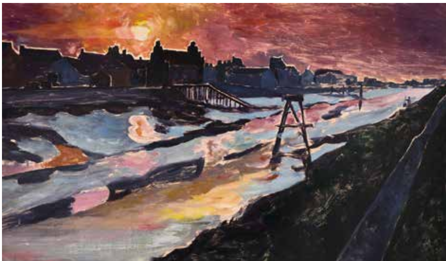
Assunta Genovesio (1972), Chenal à marée basse , 2022, monotype en couleurs - Coll. Musée de Gravelines

En bord de mer l'empreinte incertaine propre au monotype participe à l'impression de fusion des éléments du paysage, toujours mouvant. Le ciel bas se reflète sur les eaux confondues du fleuve et de la mer du Nord. L'artiste affectionne le moment du crépuscule, entre chien et loup, qu'elle interprète par un usage audacieux de la couleur.