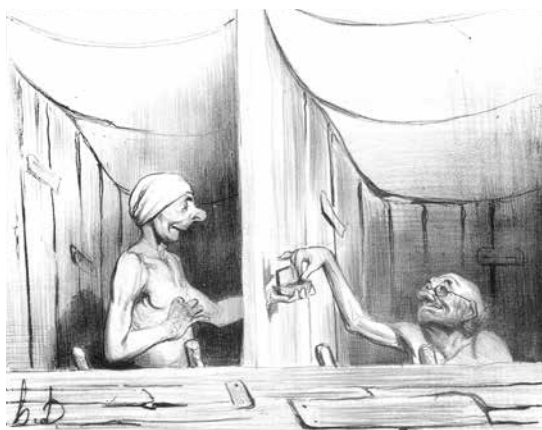
Honoré Daumier (1808 - 1879), Dites donc, père Coquardeau, il est joliment frais - Pardine ! j crois bien de la série Les baigneurs, pl. 15, pour Le Charivari, du 9 août 1840