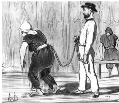
Honoré Daumier (1808 - 1879), Madame Rabourdeau à sa première leçon de la série Les baigneuses , pl. 5, pour Le Charivari , du 5 août 1847 - Coll. Musée de Gravelines