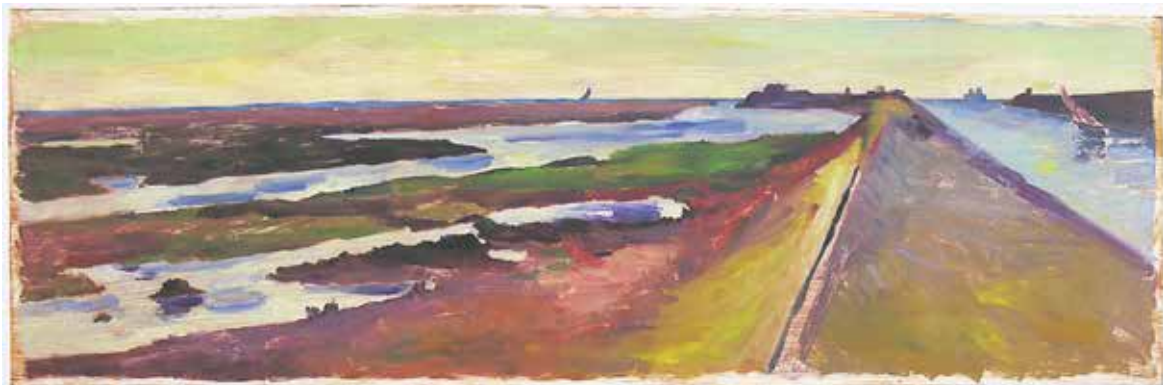
Assunta Genovesio (1972), La jetée, marée montante , 2019, monotype en couleurs - Coll. Musée de Gravelines