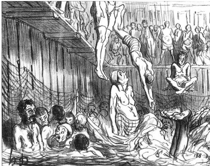
Honoré Daumier (1808 - 1879), Les baigneurs à quatre sous de la série Croquis d'été, pl. 29, pour Le Charivari, du 28 juin 1858

A l'approche de la célébration des performances olympiques, le musée présente un ensemble de près de 90 lithographies satiriques d'Honoré Daumier (1808-1879) sur le thème des baigneurs. Observateur affranchi, le dessinateur traque les turpitudes des parisiens et parisiennes se jetant à l'eau, qu'ils barbotent dans les premières piscines, trempent dans la rivière, ou qu'ils affrontent bravement les vagues. Dans un contexte où l'on commence tout juste à envisager l'intérêt d'une activité sportive, perçue comme éducative et hygiénique, l'artiste prend ce prétexte pour mettre à nu ses contemporains ordinaires, les déshabiller littéralement. Les postures et comportements de ces baigneurs et baigneuses en petite tenue dévoilent tour à tour leur ingénuité, leur maladresse ou leur hardiesse, leur conformisme, leur bêtise, et parfois même leur goujaterie.