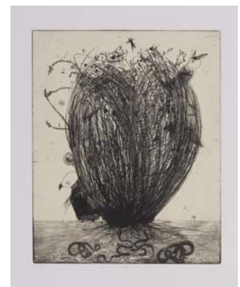
Didier Hamey, Le fourré des délices 2004, pointe sèche Coll. Musée de Gravelines © Jean-Claude Mallevaey