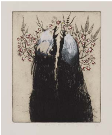
Didier Hamey Les Geishas et le petit oiseau , 2003, pointe sèche rehaussée - Collection de l'artiste