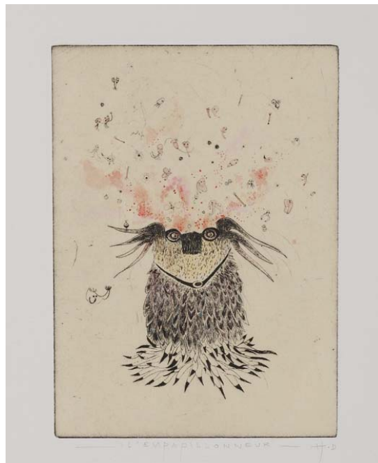
Didier Hamey, L'empapillonneur , 2009, pointe sèche rehaussée - Coll. Musée de Gravelines

L'Empapillonneur ? Deux estampes portent ce titre. L'une d'elle représente un personnage étrange, sorte de hibou-koala dont il manque la partie supérieure du crâne. L'animal se présente frontalement. Une nuée de personnages indistinctement définissables, embryons, larves, têtards ou graines se dispersent dans les airs, encore pris dans les volutes rouges et roses qui les contenaient l'instant d'avant.