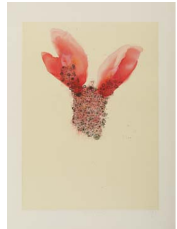
Didier Hamey, L'impatiente , 2009, pointe sèche rehaussée Collection de l'artiste