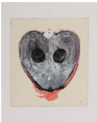
Didier Hamey, Pomme d'amour 2004, pointe sèche rehaussée Coll. Musée de Gravelines