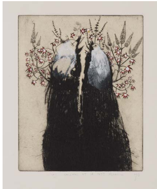
Didier Hamey, Les Geishas et le petit oiseau , 2003, pointe sèche rehaussée - Collection de l'artiste

En parcourant l'œuvre de Didier Hamey, peuplé d'êtres hybrides et joyeux entretenant dans une parfaite harmonie des relations pour le moins équivoques, vient assez rapidement à l'esprit le triptyque du Jardin des Délices de Jérôme Bosch (1453-1516). Cette œuvre magistrale continue de faire débat et l'on cherche encore à décrypter le détail des intentions du peintre qui représente un monde imaginaire fourmillant de personnages dont les attitudes insolites n'ont rien de commun avec une vie terrestre ordinaire. Folie, rêverie, symboles, paraboles, cocasseries, le panneau concentre ces composantes qui laissent si peu de place à la rationalité au profit de la liberté d'imagination. Il est vrai que l'expression de la liberté prise à bras le corps et sans complexe de jugements, donne lieu à la plus grande incompréhension pour un public en recherche permanente de repères.