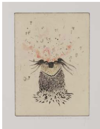
Didier Hamey, L'empapillonneur 2009, pointe sèche rehaussée Coll. Musée de Gravelines