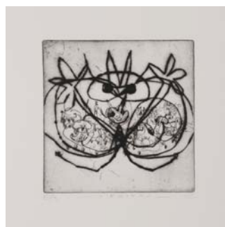
Didier Hamey, Bienvenu 1998, pointe sèche Collection de l'artiste