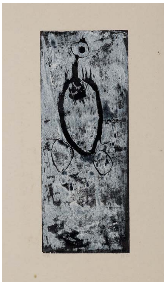
Didier Hamey, Sans titre , 1997, Gravure sur bois Collection de l'artiste