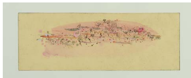
Didier Hamey, La nébuleuse aux baies rouges pointe sèche rehaussée - Collection de l'artiste