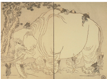
Katsushika Hokusai, Sans titre , La Manga gravure sur bois en couleurs Coll. Musée de Gravelines - Achat

1982 30 ANS. PORTRAIT D'UNE COLLECTION 2012