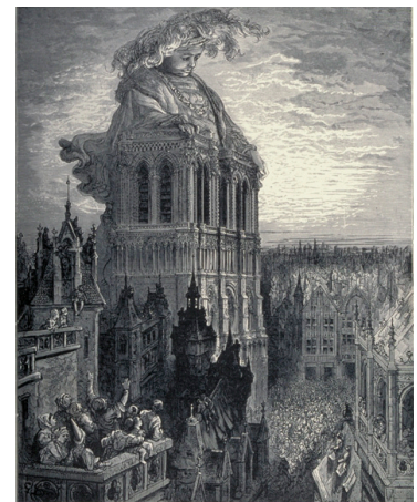
Gustave Doré, Je croy que ces marrouffles veulent que je leur paye icy ma bien venuee je leur vais donner le vin , La vie très horrifque du Grand Gargantua père de Pantagruel , 1873, gravure sur bois de bout - Coll. Musée de Gravelines Achat