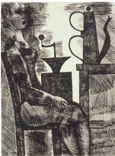
Marcel Gromaire, Le moulin à café , 1931 eau-forte - Coll. Musée de Gravelines Donation