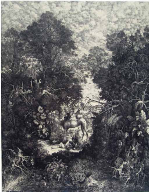
Rodolphe Bresdin, Le bon samaritain , 1861 lithographie à la plume - Coll. Musée de Gravelines Achat

Les oeuvres ci-contre et ci-dessous ne sont pas libres de droits. A charge pour le diffuseur de s'en acquitter auprès du FNAC ou de l'ADAGP.