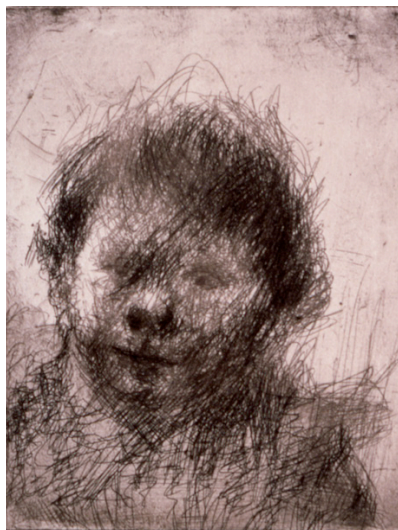
Eugène Leroy, Petite tête embroussaillée , 1964 eau-forte - Coll. Musée de Gravelines Donation