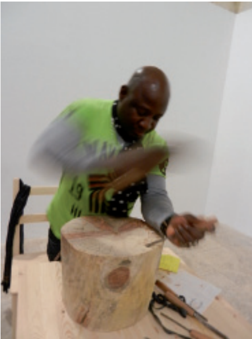
Barthélémy Togu exposition Dérive(s) 2013, Arles