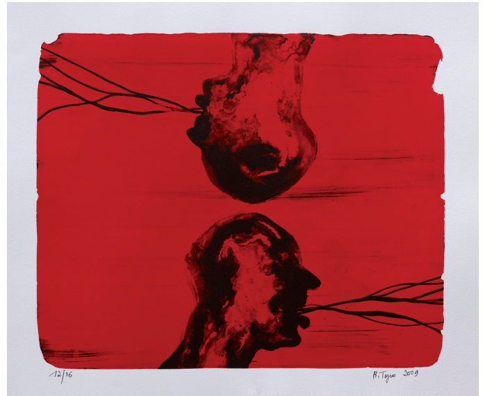
Barthélémy Toguou, Reaching Fullness , 2009, lithographie

Pour cela, Toguou met sur la place publique la question suivante : Pourquoi mon passeport de résident camerounais se remplit-il si rapidement comparé à celui de mes amis résidents de l'Union Européenne ?