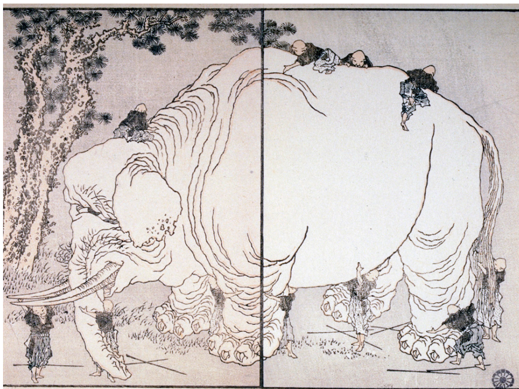
Katsushika Hokusai (Edo, 1760 - Asakusa, 1849) Onze aveugles palpent un éléphant La Manga, vol.8, 1818-1819 Gravure sur bois en couleurs

Bien que La Manga soit souvent citée pour avoir inspirée de nombreux artistes tant au Japon qu'en Occident, le contenu de ces carnets demeure relativement méconnu. Quelles sont précisément les scènes représentées par Hokusai ? Avec une acuité extrême et une vitalité exceptionnelle du trait, Hokusai illustre le Japon, les paysages dans les rizières, la beauté des sites naturels, le bestiaire fantastique du culte Shinto, les aventures épiques des samouraïs ou les facéties du petit peuple. Un premier carnet est édité en 1814. Il connaît un tel succès qu'il sera suivi de la réalisation de 14 autres albums. Très populaire, La Manga est probablement l'ouvrage le plus réédité du XIX e siècle.