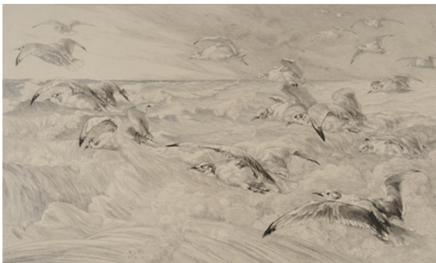
Félix Braquemond Les mouettes eau-forte et pointe sèche, 1882 Coll. Musée de Gravelines

En lien avec l'exposition Les caprices d'Hokusai , la salle du four à pain accueille une installation documentaire et musicale sur le thème de la représentation de la mer au début XX e siècle. Dès le tunnel d'accès à la casemate, les visiteurs sont plongés dans un paysage sonore déroutant. La Mer de Claude Debussy marque une rupture dans la musique du XX e siècle et participe à la recomposition artistique des paysages marins.