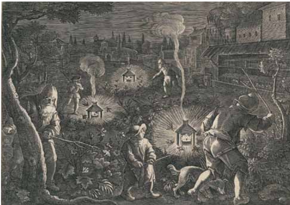
Jan Van der Straet (1523-1605) Chasse aux papillons burin, 1578-1580 Coll. Musée de Gravelines

Bien que s'appuyant sur une réalité, celle de la chasse, il ne s'agit pourtant pas ici de simples illustrations d'une encyclopédie cynégétique. En effet, si certaines scènes décrivent bien des chasses traditionnelles, la chasse à courre, ou la chasse royale au cerf, d'autres chasses apparaissent plus ou moins folkloriques, la chasse aux papillons ou le déguisement du chasseur en vache jupon, voire complètement excentriques. Ainsi les scènes de chasses exotiques décrivent des animaux aux formes et aux mœurs improbables, éléphants luttant contre des serpents, chasse aux panthères avec des miroirs... Enfin il représente avec beaucoup de verve les chasses mythologiques au dragon, à la licorne ou aux monstres marins. Les scènes les plus étranges peuvent cependant être décryptées et ont un sens symbolique.