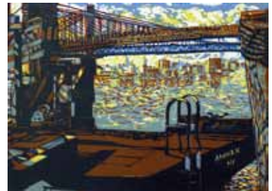
Pascale Hémary Embarquement to Brooklyn 2017, linogravure en couleurs 40 x 55 cm (coup de planche) 65 x 50 cm (feuille) Coll. Musée de Gravelines