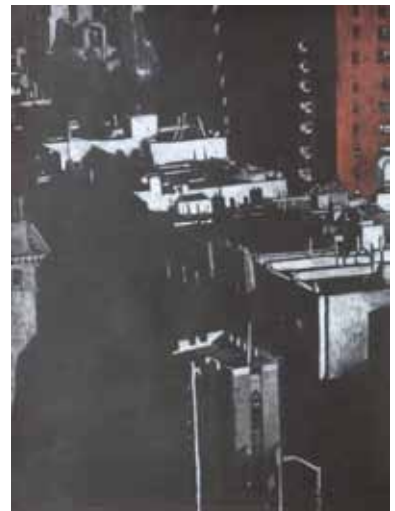
Pascale Hémary From the Heights, New York, Série noire # 2-2, New York 2016, dessin aux crayons de couleurs sur papier noir 65 x 50 cm (feuille)