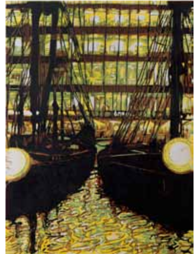
Pascale Hémary St-Katharine docks in the City, London 2014, gravure sur bois en couleurs 80 x 60 cm (coup de planche) 100 x 70 cm (feuille) Coll. Musée de Gravelines