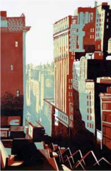
Pascale Hémary Vue du Flatiron Building, New York, 2014, gravure sur bois en couleurs 120 x 80 cm (coup de planche) 140 x 100 cm (feuille)