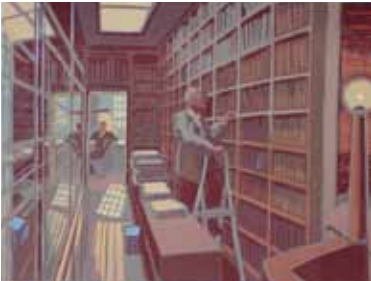
Wendelien Schönfeld Hôtel Turgot, La Bibliothèque , 2008 gravure sur bois en couleurs 30 x 40 cm (coup de planche) 37 x 50 cm (feuille)