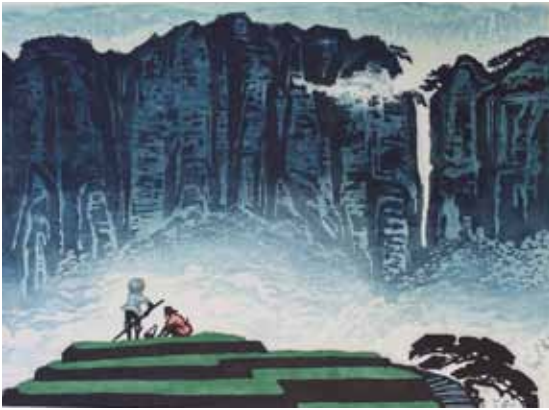
Fulin Yin, Après la pluie, le vent gravure sur bois en couleurs, 1988 50 x 65 cm - Coll. Musée de Gravelines