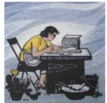
Mian Wang La belle époque gravure sur bois en couleurs 1984, 50 x 50 cm Coll. Musée de Gravelines