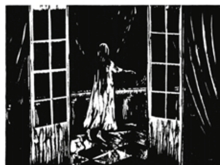
Olivier Deprez (1966 - ), Sans titre pour Wrek , 2018 gravure sur bois Collection de l'artiste