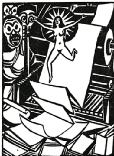
Frans Masereel (1889-1972), Sans titre pour L'idée, pl. 51, 1920, gravure sur bois - Coll. Musée de Gravelines