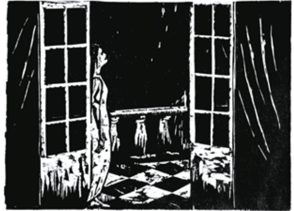
Olivier Deprez (1966 - ), Sans titre pour Wrek , 2018 gravure sur bois - Collection de l'artiste