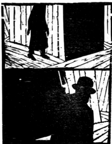
Olivier Deprez (1966- ), Le Château d'après le roman de Franz Kafka (détail), 2003, gravure sur bois Collection de l'artiste