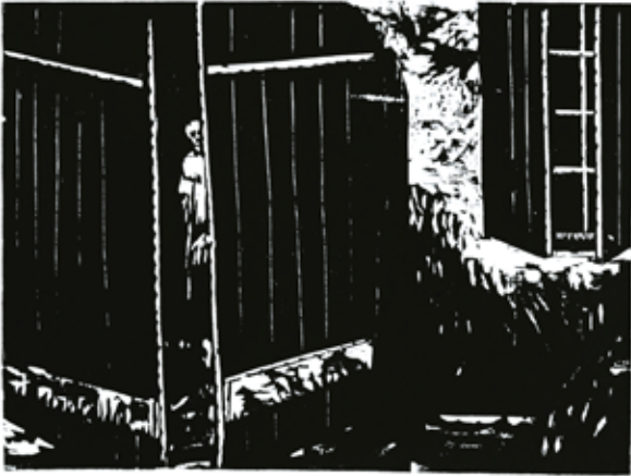
Olivier Deprez (1966 - ), Sans titre pour Wrek , 2018 gravure sur bois - Collection de l'artiste