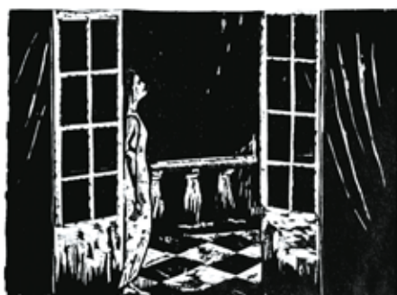
Olivier Deprez (1966 - ), Sans titre pour Wrek , 2018 gravure sur bois Collection de l'artiste