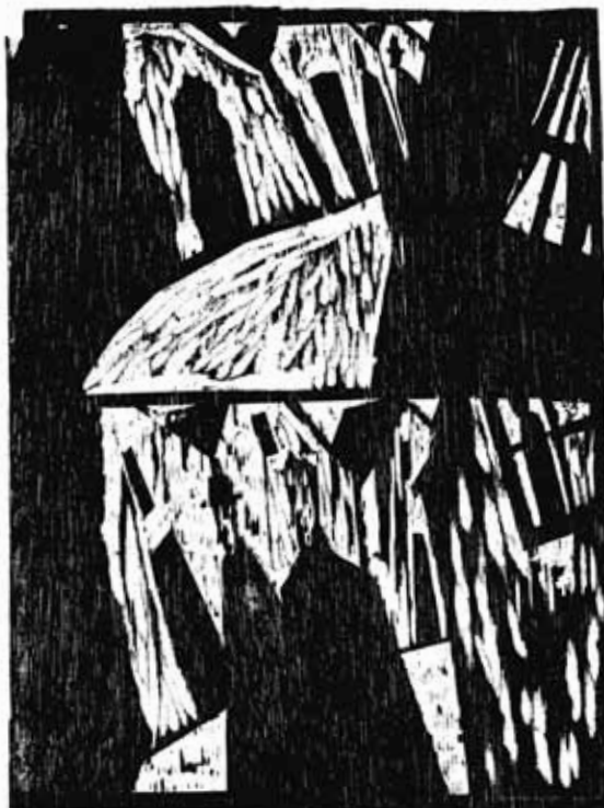
Olivier Deprez (1966- ) Le Château d'après le roman de Franz Kafka 2003, gravure sur bois Collection de l'artiste