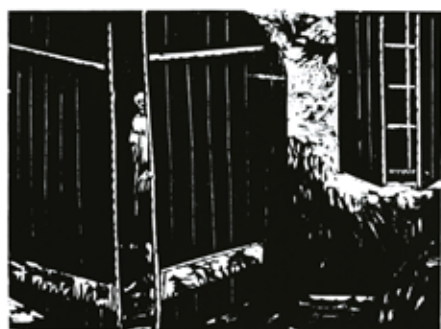
Olivier Deprez (1966 - ), Sans titre pour Wrek , 2018 gravure sur bois Collection de l'artiste