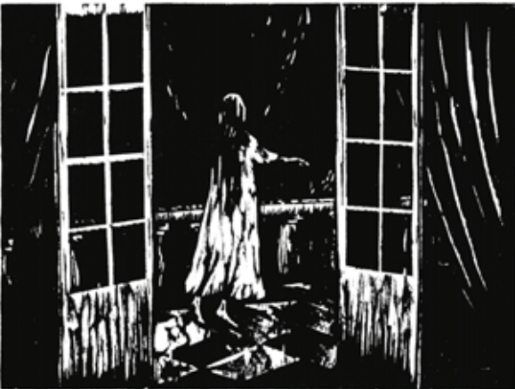
Olivier Deprez (1966 - ), Sans titre pour Wrek , 2018 gravure sur bois - Collection de l'artiste