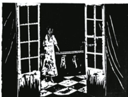
Olivier Deprez (1966 - ), Sans titre pour Wrek , 2018 gravure sur bois Collection de l'artiste