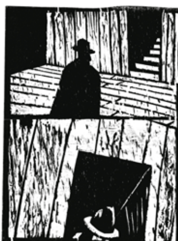
Olivier Deprez (1966- ), Le Château d'après le roman de Franz Kafka (détail), 2003, gravure sur bois Collection de l'artiste