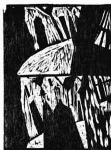
Olivier Deprez (1966- ), Le Château d'après le roman de Franz Kafka (détail), 2003, gravure sur bois Collection de l'artiste