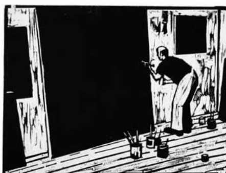
Olivier Deprez (1966 - ), Sans titre pour Wrek , 2018 gravure sur bois Collection de l'artiste