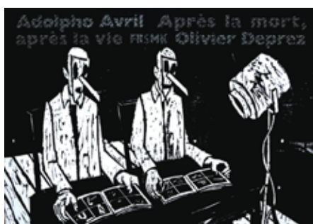
Olivier Deprez (1966 - ), Sans titre pour Après la mort, après la vie 2018, gravure sur bois Collection de l'artiste