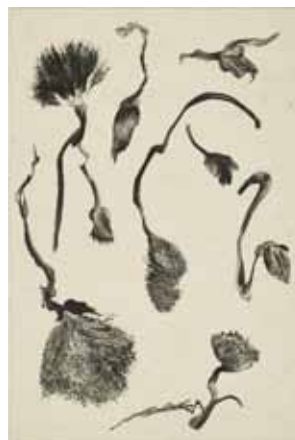
Nathalie Grall (1961- ) La Collection , pl.9, 2017 burin et roulette sur Chine appliqué Collection particulière