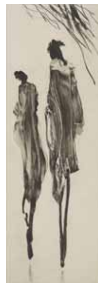
Nathalie Grall (1961- ) L'élégance du doute 2017, burin et diamant sur Chine appliqué Collection Musée de Gravelines