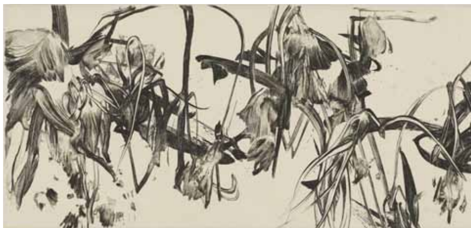
Nathalie Grall (1961- ), La fugue du jardinier 1 , 2015, burin et pointe sèche sur Chine appliqué - Collection Musée de Gravelines