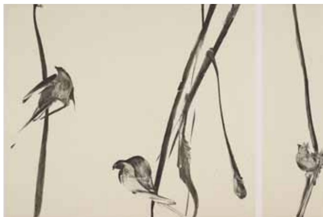
Nathalie Grall (1961- ), Partition , 2007, burin et diamant sur Chine appliqué Collection Musée de Gravelines

Que voit-on au juste ? des signes ou des choses ? des représentations stylisées de la réalité ou des songes ? des images ou des mirages ? un improbable alphabet ou l'exhibition de quelque créature zoomorphe insoupçonnée ? Même lorsque la forme tend à se naturaliser au maximum, on voit, on sent et pressent qu'elle pourrait emprunter in extremis une autre voie.