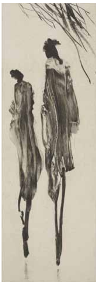
Nathalie Grall (1961- ), L'élégance du doute , 2017 burin et diamant sur Chine appliqué Collection Musée de Gravelines