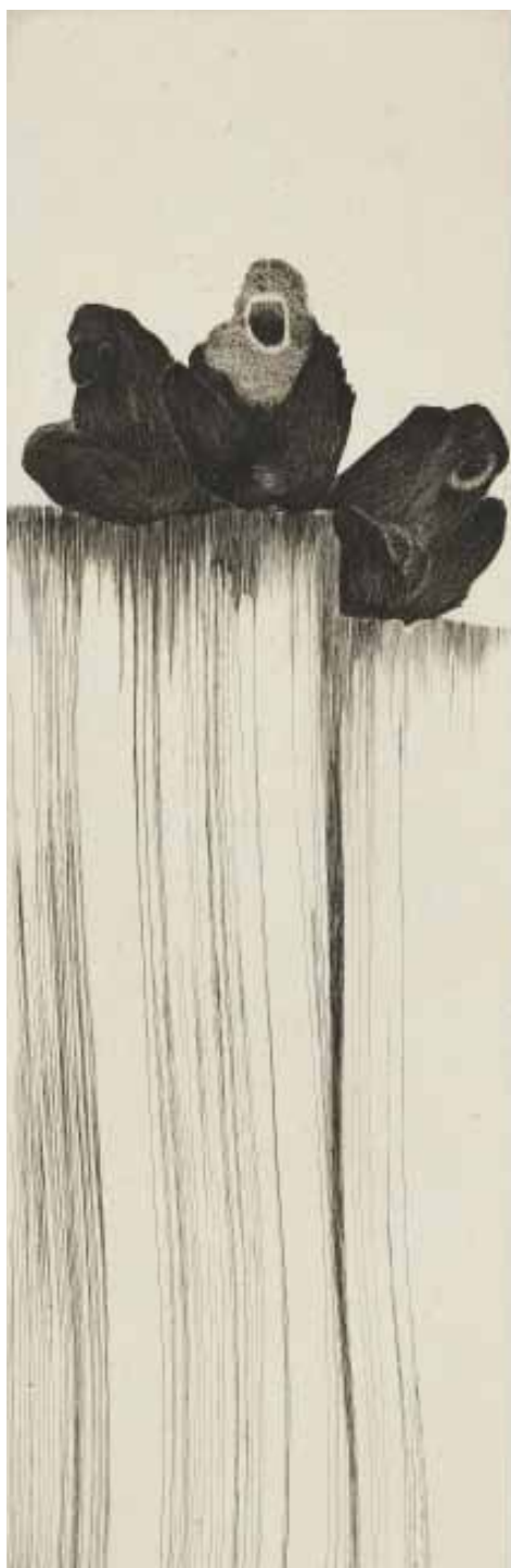
Nathalie Grall (1961-), Trois silences , 2011, burin sur Chine appliqué - Collection Musée de Gravelines

Tout commence avec le pinceau tenu à la verticale sur la plaque de cuivre, tout est affaire de sensation et de geste, celui du peintre-calligraphe dans un premier temps, puis celui du graveur.