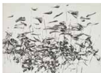
Nathalie Grall (1961- ) L'envolée de l'embellie , 2013 burin et diamant Collection Musée de Gravelines