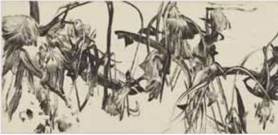
Nathalie Grall (1961- ), La fugue du jardinier 1 , 2015 burin et pointe sèche sur Chine appliqué Collection Musée de Gravelines