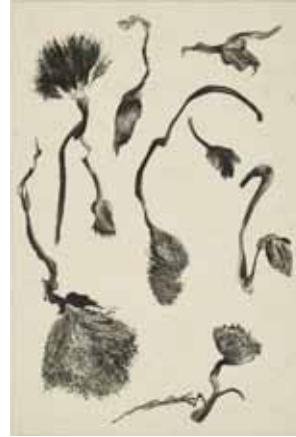
Nathalie Grall (1961- ) La Collection , pl.9, 2017 burin et roulette sur Chine appliqué Collection particulière