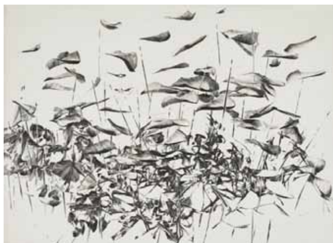
Nathalie Grall (1961-), L'envolée de l'embellie , 2013, burin et diamant Collection Musée de Gravelines

L'étonnant c'est que la deuxième phase de son travail de création, la gravure au burin, n'entame en rien l'éphémère subtilité de ces figures hybrides à la fois animales, humaines, végétales, ou de ces paysages ouverts qui invitent au voyage et à la rêverie. Au contraire, c'est comme si les traits du burin matérialisaient cette évanescence en la sculptant dans le métal, aidant l'artiste à retrouver grâce à la lame qui vibre sous sa main l'impression de départ qui l'a émue.