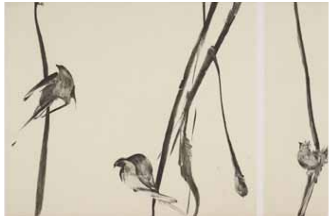
Nathalie Grall (1961- ), Partition , 2007, burin et diamant sur Chine appliqué Collection Musée de Gravelines

Que voit-on au juste ? des signes ou des choses ? des représentations stylisées de la réalité ou des songes ? des images ou des mirages ? un improbable alphabet ou l'exhibition de quelque créature zoomorphe insoupçonnée ? Même lorsque la forme tend à se naturaliser au maximum, on voit, on sent et pressent qu'elle pourrait emprunter in extremis une autre voie.