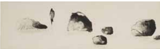
Nathalie Grall (1961- ), Paysage méditatif au bord des larmes , 2003 burin et diamant sur Chine appliqué - Collection Musée de Gravelines