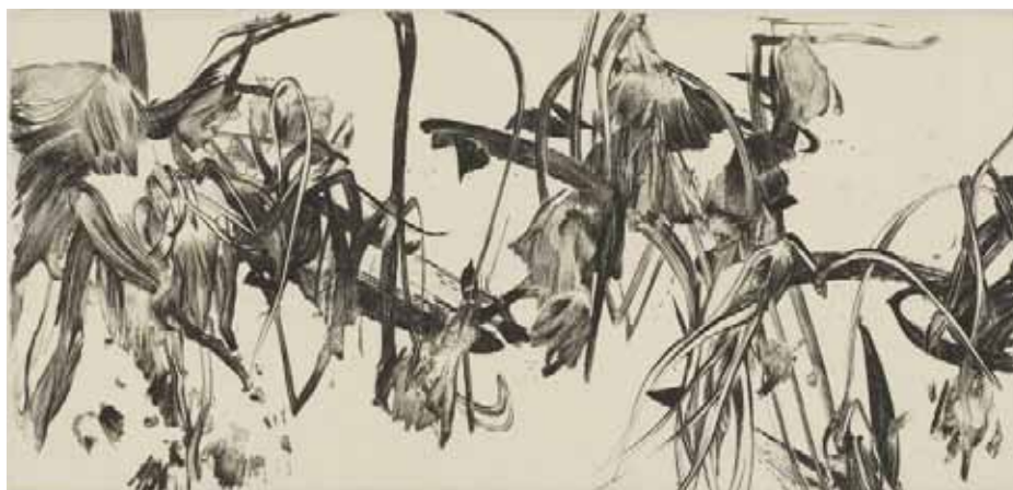
Nathalie Grall (1961- ), La fugue du jardinier 1 , 2015, burin et pointe sèche sur Chine appliqué - Collection Musée de Gravelines