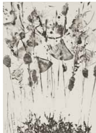
Nathalie Grall (1961- ) Le bataillon des mousses 2013, burin sur Chine appliqué Collection Musée de Gravelines