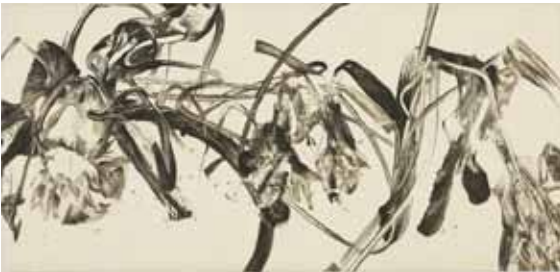
Nathalie Grall (1961- ), La fugue du jardinier 2 , 2015 burin et pointe sèche sur Chine appliqué Collection Musée de Gravelines