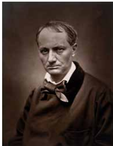
Etienne Carjat, caricaturiste, photographe, poète (1828-1906), Portrait de Charles Baudelaire, 1862, tiré de la Galerie Contemporaine, Ed. Baschet, Paris, 1878, épreuve photoglyptique.

Malgré les mauvais augures, la rencontre entre gravure et photographie marque leur libération, les détachant de la fonction de reproduction servile, engendrant, par leur fusion, un médium artistique original et toujours actuel : la photographie imprimée.