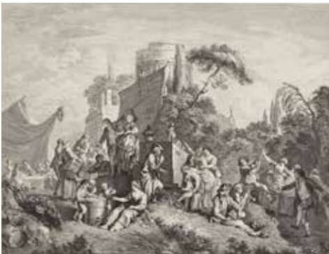
Charles-Nicolas Cochin, dit le jeune (1715-1790), d'après François Boucher (1703-1770), Foire de campagne , 1740, eau-forte, épreuve avant la lettre, sur papier vélin. Coll. Musée de Gravelines. Inv. 2019.06.0001