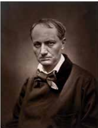
Etienne Carjat, caricaturiste, photographe, poète (1828-1906), Portrait de Charles Baudelaire, 1862, tiré de la Galerie Contemporaine, Ed. Baschet, Paris, 1878, épreuve photoglyptique.