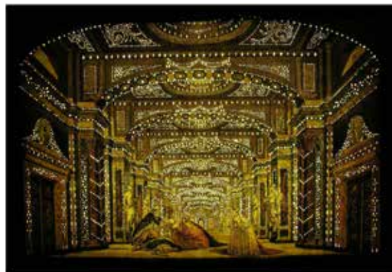
Auteur non identifié, Vue d'optique, Sans titre , vers 1770, épreuve d'un burin rehaussée au revers et percée, sur papier vergé. Effets diurne et nocturne d'une vue d'optique à illuminations, vue de jour non éclairée et vue éclairée au revers. Coll. particulière