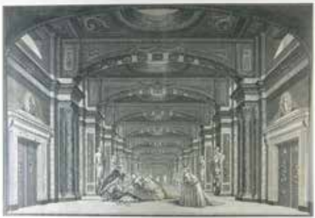
Auteur non identifié, Vue d'optique , Sans titre , vers 1770, épreuve d'un burin rehaussée au revers et percée, sur papier vergé. Effets diurne et nocturne d'une vue d'optique à illuminations, vue de jour non éclairée et vue éclairée au revers. Coll. particulière