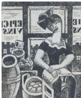
MARCEL GROMAIRE - EUGENE LEROY aux origines d'un musée 4 juillet - 1 er novembre 2020