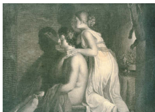
CONTACTS PHOTOGRAPHIE-GRAVURE jeux et enjeux 29 novembre 2020 - 23 mai 2021