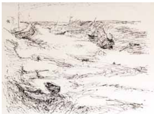
La jetée de Grand-Fort-Philippe , 1967, encre de Chine 45,6 x 63 cm (feuille) - Coll. musée de Gravelines