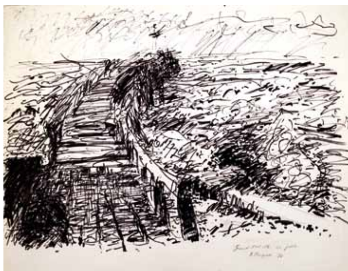
Grand-Fort-Philippe - La jetée 1974, feutre, 50 x 65 cm (feuille)