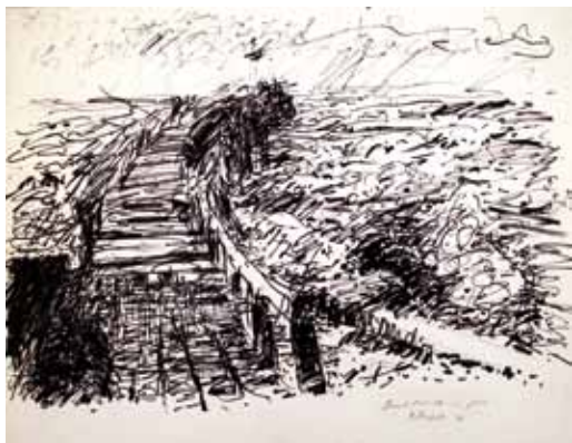
Grand-Fort-Philippe - La jetée 1974, feutre, 50 x 65 cm (feuille) Coll. musée de Gravelines