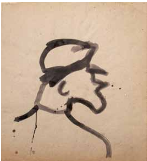
Tête de marin III , 1980, encre de Chine 75 x 70 cm (feuille) - Coll. musée de Gravelines