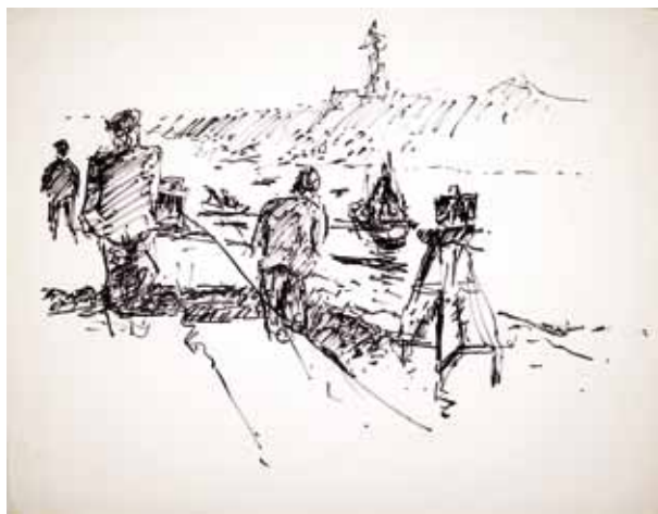
Marins sur le quai , XX e , feutre, 50 x 65 cm (feuille) Coll. musée de Gravelines