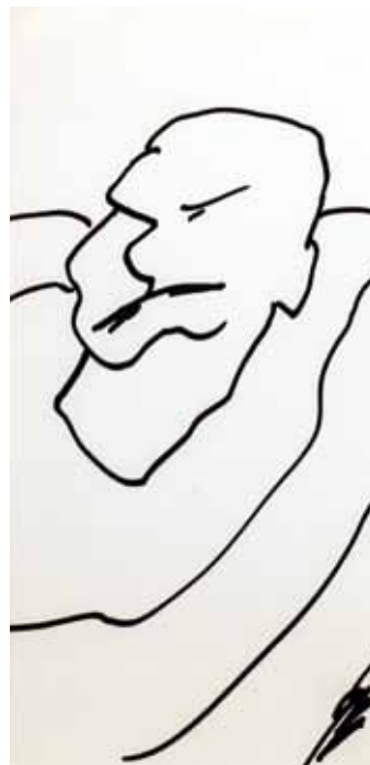
Sans titre 1 pour la suite Pour le marin mort XX e , feutre, 32 x 16.5 cm (feuille) Coll. particulière