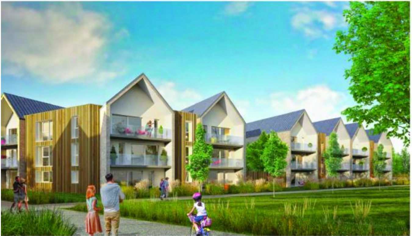
Vue A - Vue immobilière collective au sein d'un lot dans la zone urbaine

Contact : accession sociale et logements locatifs intermédiaires : 03 21 19 01 50 (Habitat Hauts de France) // Lots libres : 06 89 11 26 04 (Habitat Hauts de France)