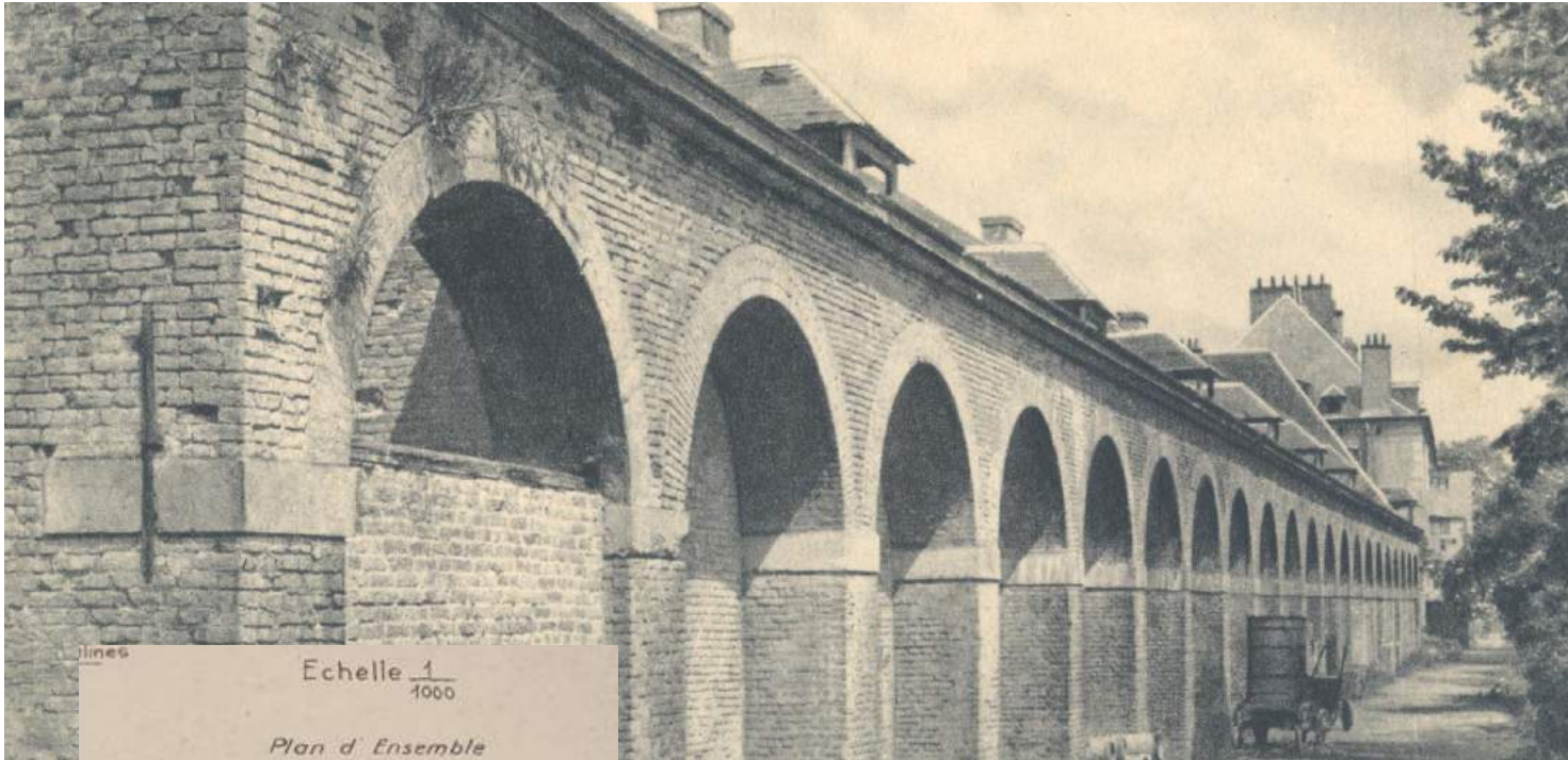
La Caserne Huxelles en 1910.

La caserne Huxelles porte le nom du Marquis Louis Chalon du Blé, tué lors du siège de Gravelines en 1658. Elle fut construite entre 1793 et 1822, près de la grande citerne. Elle est constituée par un ensemble de casemates parallèles aux remparts et voûtées, à l'épreuve des bombes.