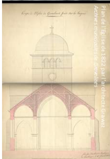
Plan de l'église de 1822 par l'architecte Gravez

A l'origine, c'était une « église-halle » à 3 nefs. Mais l'édifice connut de nombreuses dégradations notamment pendant le siège de la ville par Gaston d'Orléans en 1644 et dix ans plus tard, lors de l'explosion de la poudrière du château. L'église fut utilisée comme champ de manoeuvre, comme entrepôt, salle des ventes puis Temple de la Raison sous la Révolution.