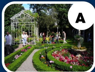
Le Jardin de la Liberté