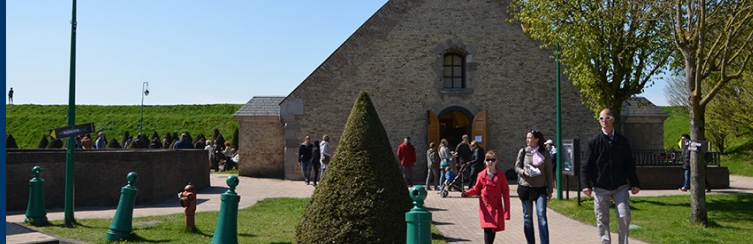
Le Musée du Dessin et de l'Estampe Originale