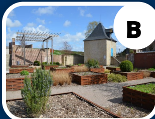
Le Jardin Carnot