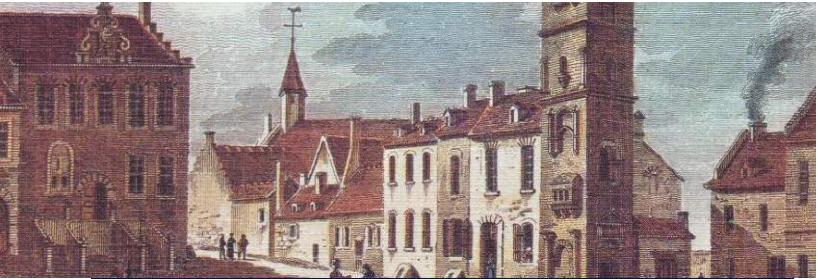
Places d'Armes au XIX siècle avec la maison de Ville, l'ancien Hôtel de Ville