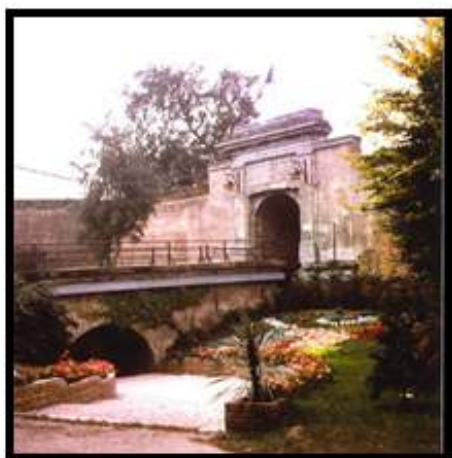
Le site de l'Arsenal dans les années 80

De nos jours, le site de l'Arsenal, clos de murs et de talus de verdure, est inspiré des jardins à la française. Le jardin est dominé par une sculpture « la Vigie ». La « Conversation » de Charles Gadenne et tout un ensemble de statues de bronze mettent en valeur le thème de l'être humain.