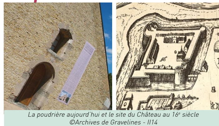
La poudrière aujourd'hui et le site du Château au 16 e siècle ©Archives de Gravelines - II14