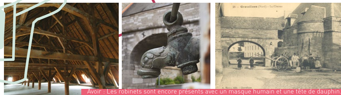
Avoir : Les robinets sont encore présents avec un masque humain et une tête de dauphin.

Nous arrivons à la citerne. Bâtie en 1724, elle contenait 1 420 000 litres d'eau. Aujourd'hui, les cuves sont vides mais les combles se visitent lors de journées exceptionnelles. On vous le conseille, la charpente d'époque est impressionnante !