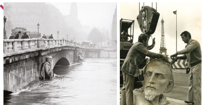
Photo de gauche : Le pont de l'Alma, crue de la Seine en 1920 Photo de droite : Réinstallation du zouave à Paris - années 70

Point de départ : le Musée du dessin et de l'estampe originale. Aviez-vous déjà remarqué que ce lieu est un bâtiment historique ? C'est une ancienne poudrière ! Si vous regardez au-dessus de la porte d'entrée, on voit la date de construction : 1742. Vous êtes au cœur du site de l'Arsenal, où on découvre les vestiges du château. Et pourtant pas de donjon en vue... C'est parce que le site, qui regroupait à l'époque de Vauban, une dizaine de bâtiments, était déjà un arsenal militaire construit sur les vestiges d'un château édifié par Charles Quint au 16 e siècle !