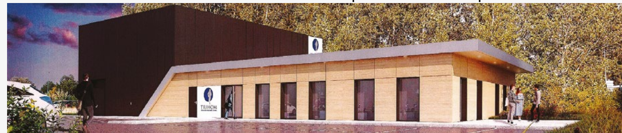
Projet de construction de l'extension du centre de formation Trihom au Parc du Guindal - Permis de construire signé récemment par Bertrand Ringot / Santer Vanhoof Architectes

24, rue Charles Leurette - 59820 GRAVELINES Compte Facebook "Gravelines passionnement"