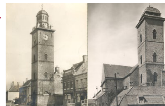
Le beffroi à gauche et la tour de l'église à droite

Remontez la rue Vanderghote et contournez la rue de Calais pour rejoindre la place Albert Denvers. Impossible de rater notre beffroi ! Il est présent au centre de la ville et culmine à 27 m. Cette tour de brique de sable vous rappelle peut-être quelque chose ? Effectivement, il y a une ressemblance avec celle de l'Eglise. Les deux tours ont été reconstruites au 19 e siècle par le même architecte.