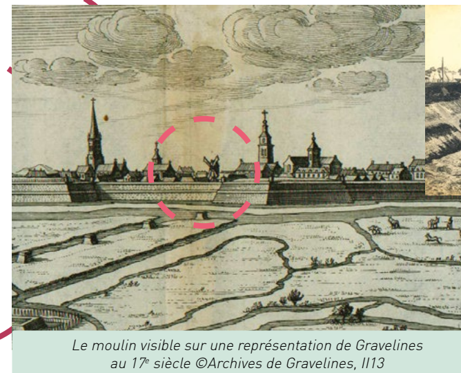
Le moulin visible sur une représentation de Gravelines au 17 e siècle