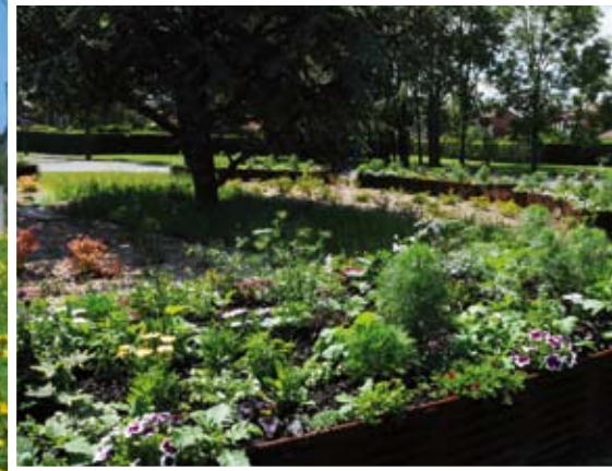
Les bacs à fleurs ont été réalisés par l'association AGIR.