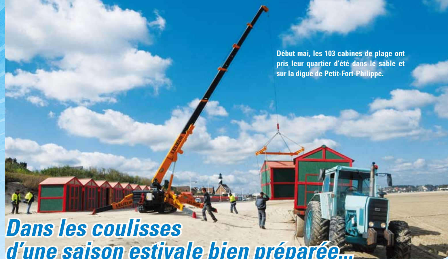
Début mai, les 103 cabines de plage ont pris leur quartier d'été dans le sable et sur la digue de Petit-Fort-Philippe.

Nos restaurateurs passeront également aux couleurs de l'été. Les Trésors de l'Été agrémenteront leurs sets de table, et proposeront d'une part la programmation estivale mais également des jeux aux enfants. Une pochette de crayons de couleur leur sera offerte.