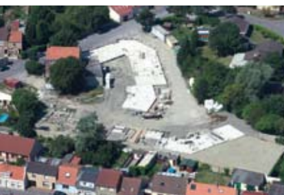
Etat de friche après démolition de la Brasserie