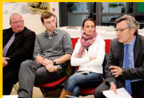
L'évolution de la médecine générale