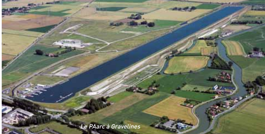
Le PAarc à Gravelines

Le syndicat intercommunal est administré par un comité syndical , organe délibérant composé de délégués élus par les conseils municipaux des communes membres. Le nombre de délégués titulaires par commune est fonction de la population de chaque commune. ■