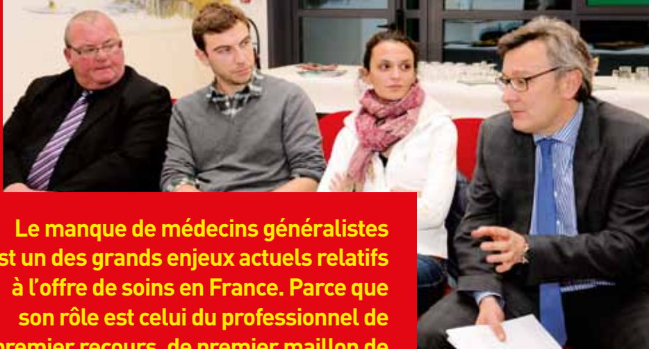
Réunion de présentation des projets de la ville en matière de santé, à destination de jeunes médecins généralistes

Le manque de médecins généralistes est un des grands enjeux actuels relatifs à l'offre de soins en France. Parce que son rôle est celui du professionnel de premier recours, de premier maillon de la chaîne d'un parcours de soins, la question de sa présence sur tous les territoires est centrale.