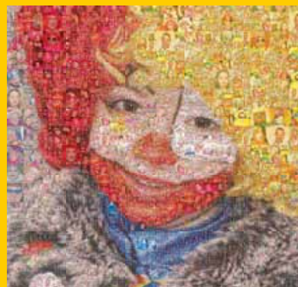
La saison carnavalesque