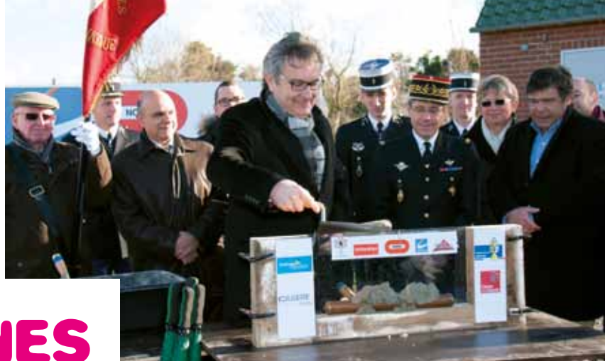
1 re pierre des 38 logements de la Gendarmerie