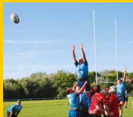
Le Rugby Club Maritime en développement