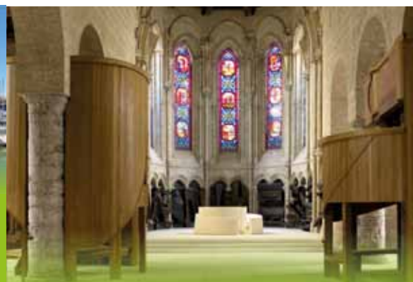
Le Chœur de Lumière à Bourbourg

Horaires d'ouverture : du lundi au vendredi de 8 h 30 à 12 h, et de 13 h 30 à 17 h