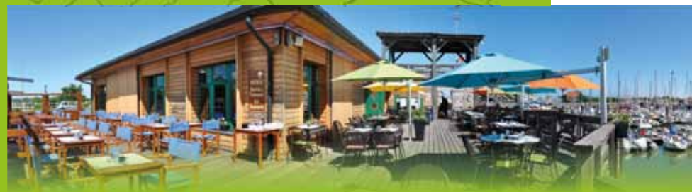
Le Cap Compas inauguré le 17 décembre 2005