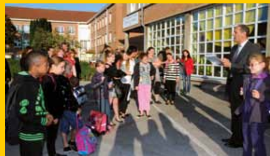
La réforme des rythmes scolaires