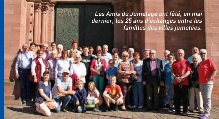
Les Amis du Jumelage ont fêté, en mai dernier, les 25 ans d'échanges entre les familles des villes jumelées.

Il ne dépend que de nous tous de mieux vivre ensemble. La Ville y prend sa part, mais chacun doit y contribuer en étant plus attentif aux autres, en respectant les règles de vie en société, en respectant les lois. Respecter les principales règles de vie en communauté, c'est vivre dans une ville plus agréable, plus conviviale.