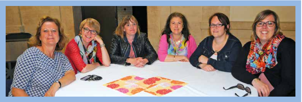
Les enseignants de Gravelines ont tous été conviés, le 30 juin, à une réception en leur honneur, donnée par la Municipalité.

Nos écoles poursuivent également leur informatisation avec, à ce jour, 18 TBI (Tableau Blanc Interactif) installés et 8 supplémentaires qui le seront d'ici la fin d'année 2016 . C'est un nouvel outil qui a fait ses preuves et dont tout le monde est satisfait. Il correspond aux nouvelles générations et permet une plus grande interactivité en classe. Nous tenons d'ailleurs à remercier le personnel de la DSI (Direction des Systèmes d'Information) pour la mise en place, l'aide à la prise en main et tout le travail qu'il fournit autour de ces TBI.